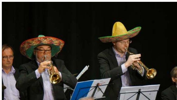
Speedy Gonzales , trompettes mexicaines