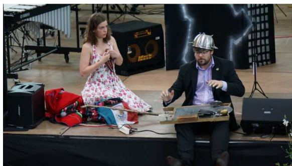
Coup de blues à la Nouvelle-Orléans