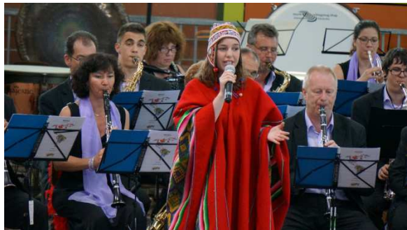
El Condor pasa , Quien sera ?