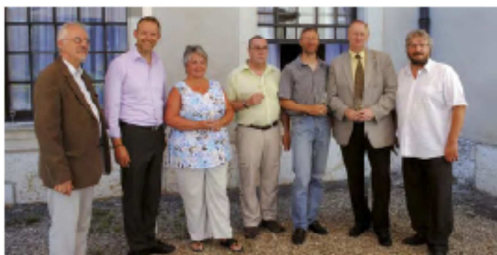
Des représentants de la Fanfare municipale de Vernier ont été reçus et félicités par le Conseil administratif.