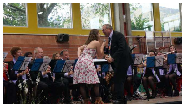
Duo rock pour Knock on Wood