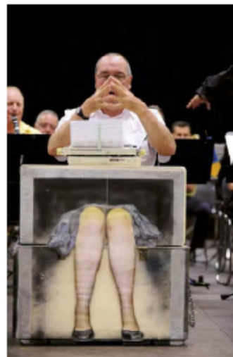
Le spectacle original «D'une rive à l'autre» a enthousiasmé le jury.

C'est tout d'abord les douceurs des mélodies de l'enfance Qui bercent nos cœurs et riment avec innocence Puis vient des copains et l'adolescence Période pleine de découvertes et de turbulences Suivie de la vie professionnelle d'adulte Avec son lot d'emmerdes et son tumulte La vieillesse annonce le temps de la retraite Les jours, les années s'égrenent, rien ne les arrête Quels qu'aient été notre vie et notre sort Finalement la vie triomphera de la mort