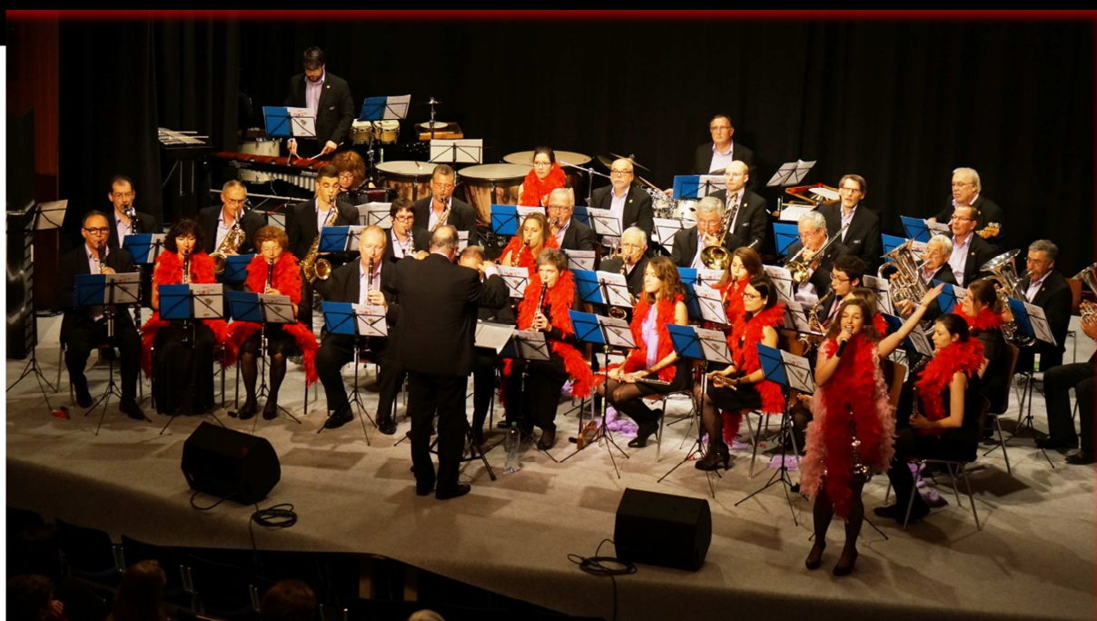
Americas, FFM2016 – 11 juin 2016