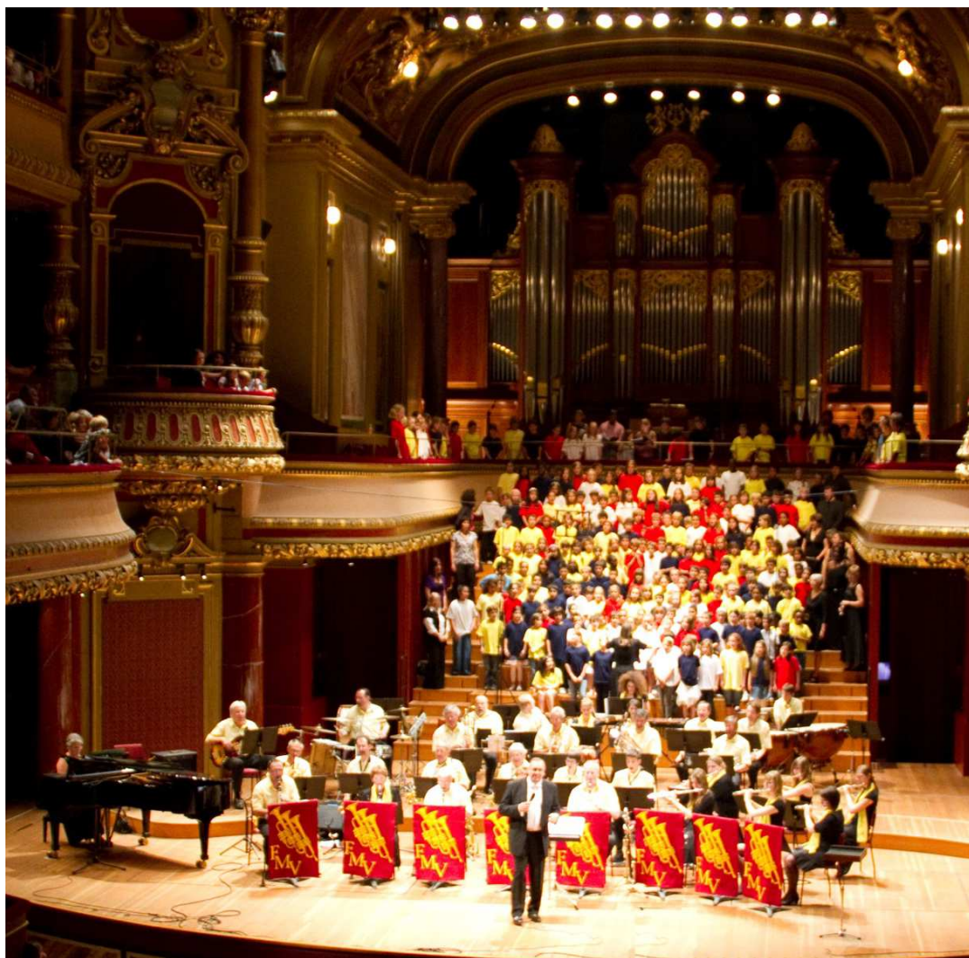
Victoria Hall, Rêves d'enfants, 29 mai 2010