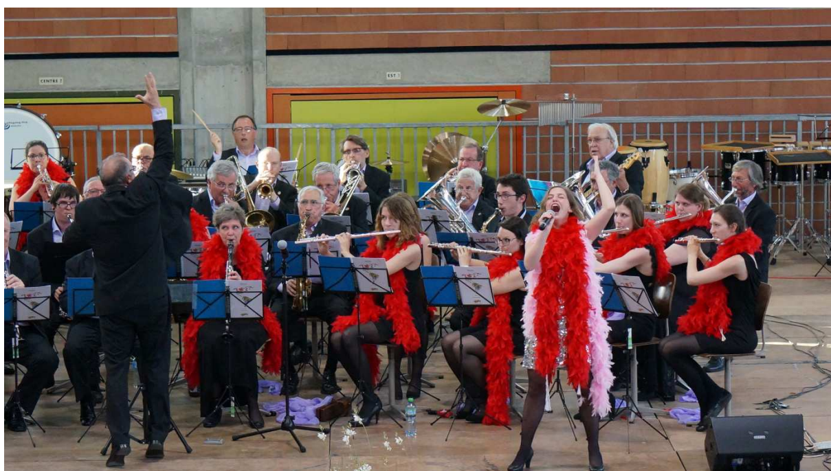
New York, New York, le final d' Americas . Concentration extrême pour la dernière note.